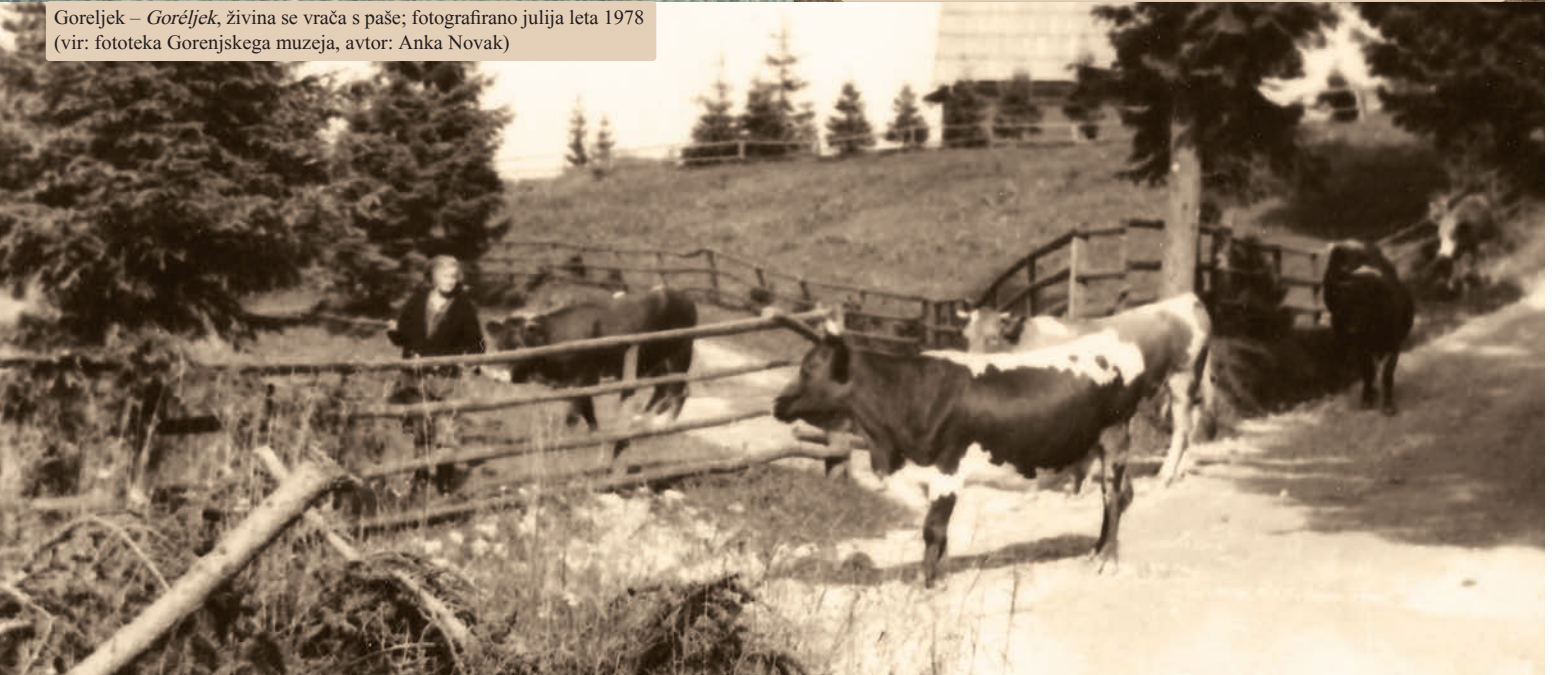
Gorenjok – Gorenjok, živina se vrača s pasc, fotografirano julija leta 1978