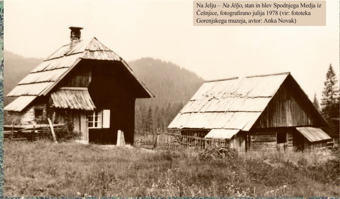
Na Jelu – Na Aljov stani in hlev Spodnjega Medja iz Čeljence, fotografirano julija 1978