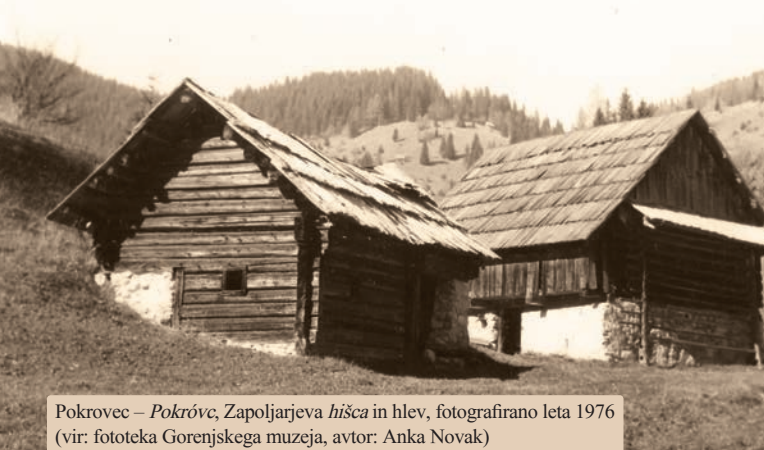
Pokrovec – Pokróvce, Zapoljarjeva hiša in hlev, fotografirano leta 1976

Zapis ledinskih imen Za jezikoslovno obravnavo domačih, tj. narečnih ledinskih in bišnih imen je najpomembnejši natančen fonetični zapis njihovega narečnega izgovora z naglasom vred, kar skupaj z zgodovinskimi viri in morebitnimi pojasnili domačinov omogoča pravilno poknjžitev in razlago vsakega imena. Za jezikoslovno predstavitve pa se lahko uporabi t. i. poenostavljeni narečni zapis, tj. zapis narečja s črkami knjižne abecede in znakom za polglasnik ter z oznako jakostnega naglasa (za mesto naglasa ter dolžino in kakovost naglasenih samoglasnikov), medtem ko se omenili samoglasnikov ne piše ali kako drugače označuje. Na primer: polglasnik, kot se v slovenskem knjižnem jeziku izgovarja v besedi 'pes', se zapiše z znakom o (torej paš , če je kratko naglasen, tára 'trta', če je dolgo naglasen, in pečak 'petek', če ni naglasen), strešica na e in o pomeni njun široki in dolgi izgovor (slov. knj. kóza , séštra ), ostvica nad ma ima dva pomena: znamo, da se izgovarjata dolgo in ozko (slov. knj. zvéda , mísi ), medtem ko ostvica na črkah a , u in o označuje le njihovo dolžino (slov. knj. gláva , máha , híša ). Kratice vedno označuje kratak izgovor naglasnega samoglasnika (slov. knj. brát , míš , kúp , kmét , króp ).