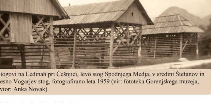
Stogovi na Lednab pri Česnjici, levo stog Spodnjega Medja, v sredini Štefanov in demno Vogarjev stog, fotografirano leta 1959

Ledinska imena Ledinska imena poimenujejo najmanjše geografske enote: gore, vrhove, doline, pobočja, gozdove, travnike, polja, poti, močvirja in drugo. Ledinska imena so ljudem nekoč služila za orientacijo v njihovem bližnjem življenjskem okolju in pri njihovih kmetijskih opravilih, danes so pomembna kot orientacijske točke. Starost ledinskih imen je različna, nekatera segajo v začetke poselitve, druga pa so mlajša. Ledinska imena so zrcalo zgodovinskega in jezikovnega razvoja pokrajine. V domači krajevni narečni govorici so se prenašala iz roda v rod, spreminjala pa se je način njihove izgovarjave in zapisa.